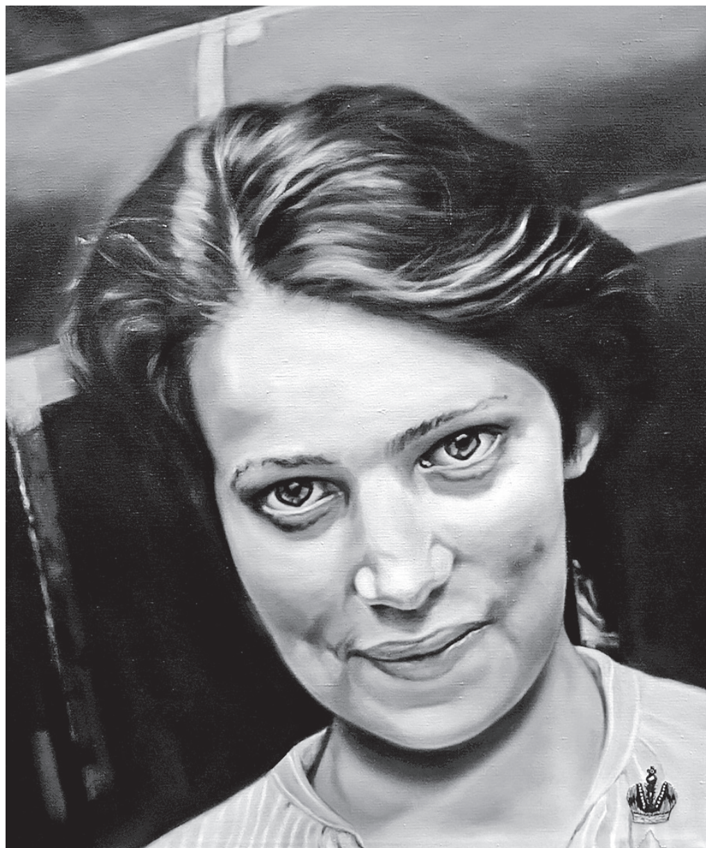
ANNA ANDERSON Õli lõuendil, tikand 90 x 75 cm 2016

1920. aastal sattus ühte Berliini hullumajja enesetapukatse üle elanud tundmatu naine. Hiljem Tšaikovski ja Andersoni nime kasutanud naisterahvas kogus 1922. aasta märtsis tuntust väitega, et on suurhertsoginna Anastasia Romanova, Venemaa viimase keisri Nikolai II noorim tütar. Hoolimata sellest, et juba 1927. aastal selgitati välja, et Anderson on tegelikult vaimuhaigusi varemgi põdenud poolatarist vabrikutöölise Franziska Schanzkowska, leidis kuni tema surmani 1984. aastal inimesi, kes uskusid teda olevat kadunud suurhertsoginna. Tõde selgus alles 2007. aastal, mil viimaks leiti tõelise Anastasia keha.