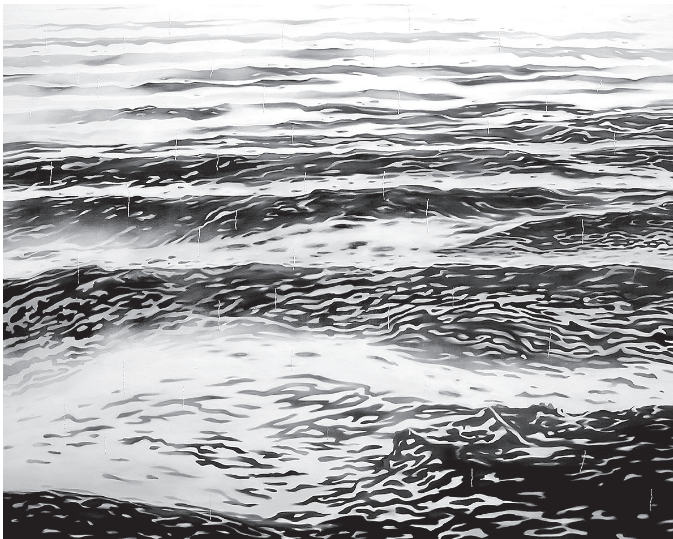
MUUTUV VESI Õli lõuendil, tikand 148 x 185 cm 2016