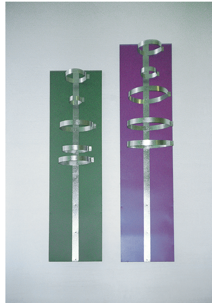
Вид с выставки в 1996 году

Оцинкованный лист жести, краска 186 x 110 x 1.6 см 1996/2019