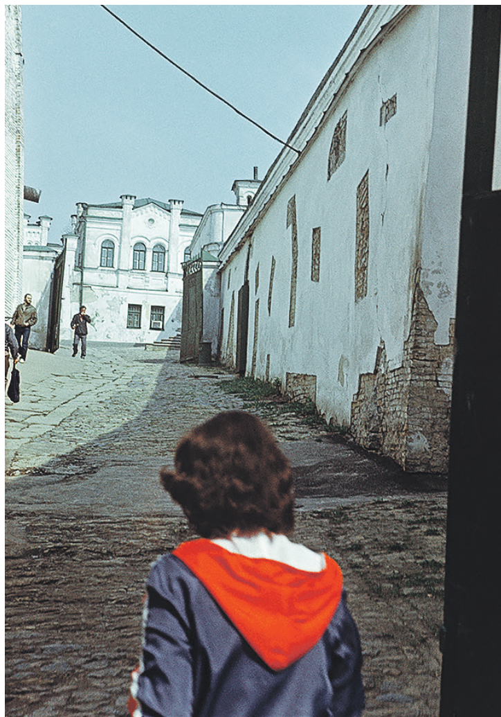
Київ, апрель 1986