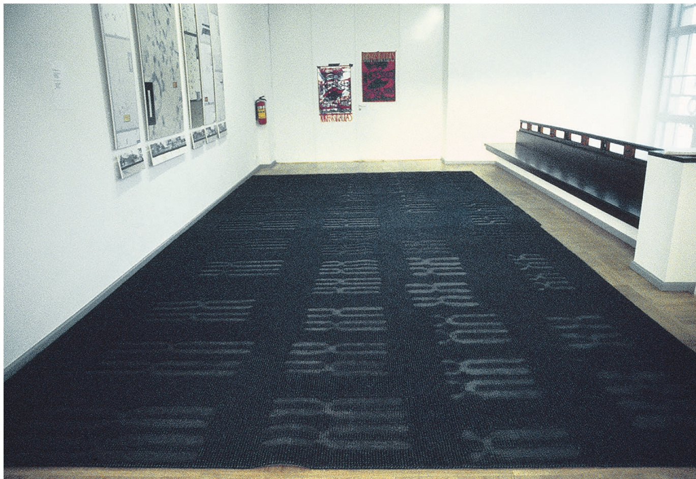
Вид с выставки Биология в Таллинском Доме Искусства в 1995 году.