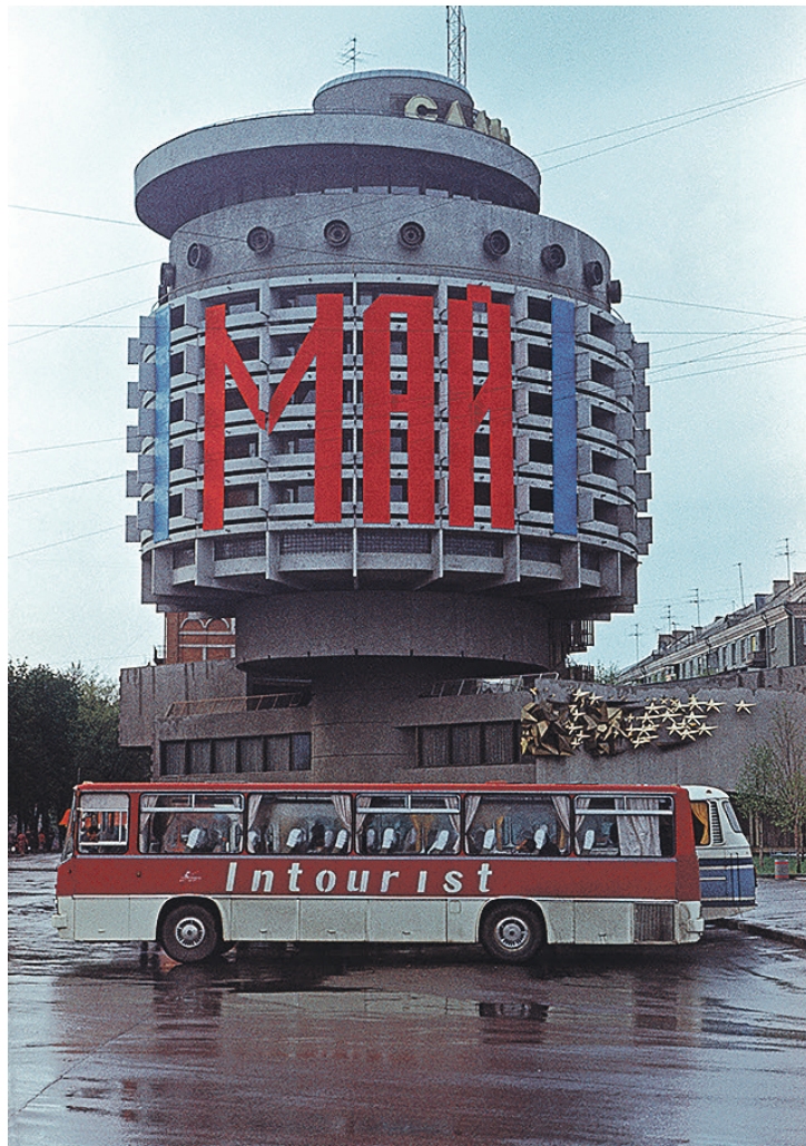
Київ, апрель 1986