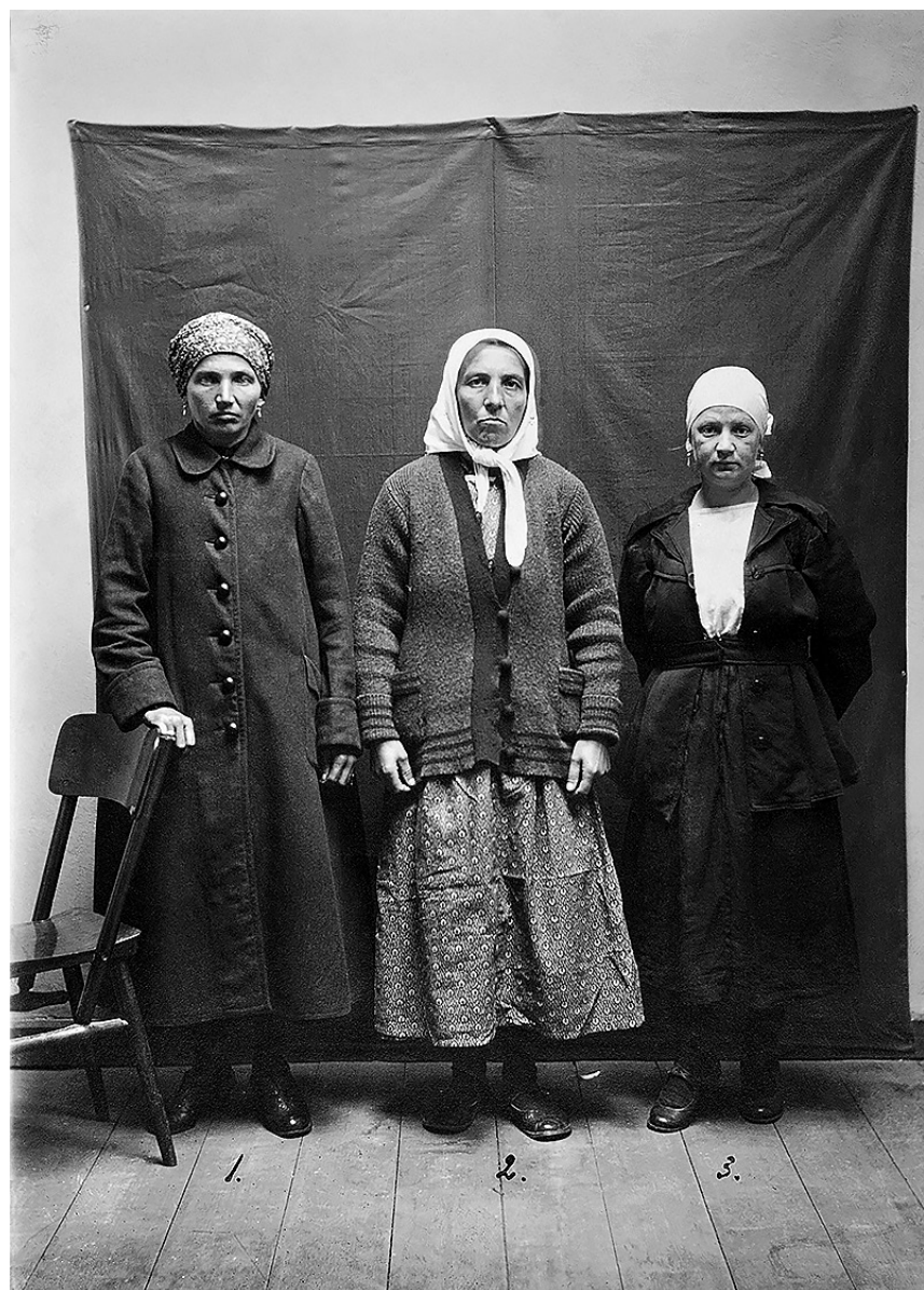
Фото из альбома криминальной полиции Выру, 1922 г. ЕФА.312.А.230.