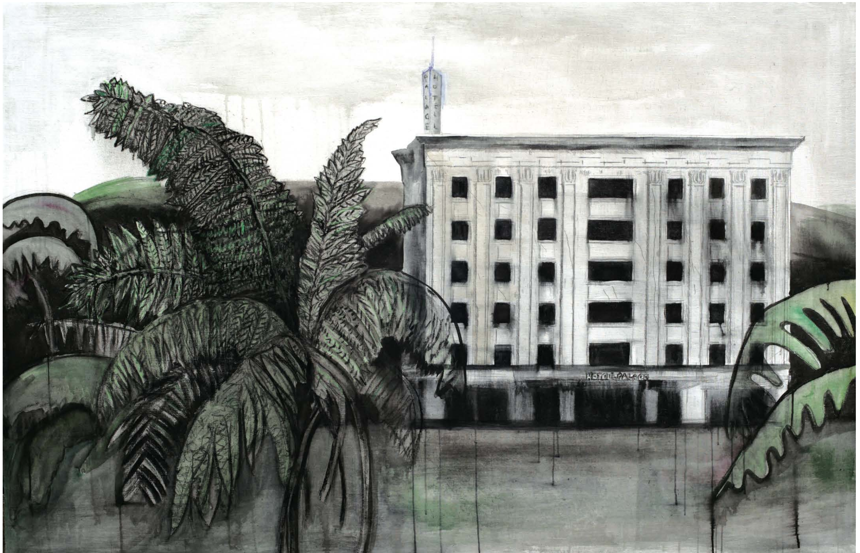
Düstööpiline Palace hotell, Tallinn, Hübridjoonistus lõuendil, 130 x 200 cm, 2017 Dystopic Palace Hotel, Tallinn, Hybrid drawing on canvas, 130 x 200 cm, 2017 Дистопический отель Palace, Таллинн, Холст, гибридный рисунок, 130 x 200 см, 2017