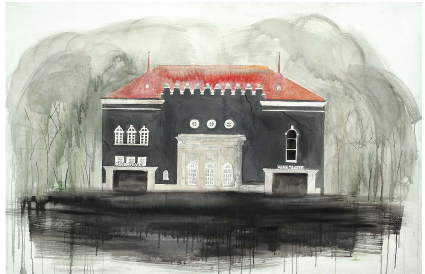
Düstoopiline Vene Teater, Tallinn, Hübriidjoonistus lõuendil, 130 × 200 cm, 2017 Dystopic Russian Theatre, Tallinn, Hybrid drawing on canvas, 130 × 200 cm, 2017 Дистопический Русский театр Эстонии, Таллинн, Холст, гибридный рисунок, 130 × 200 см, 2017