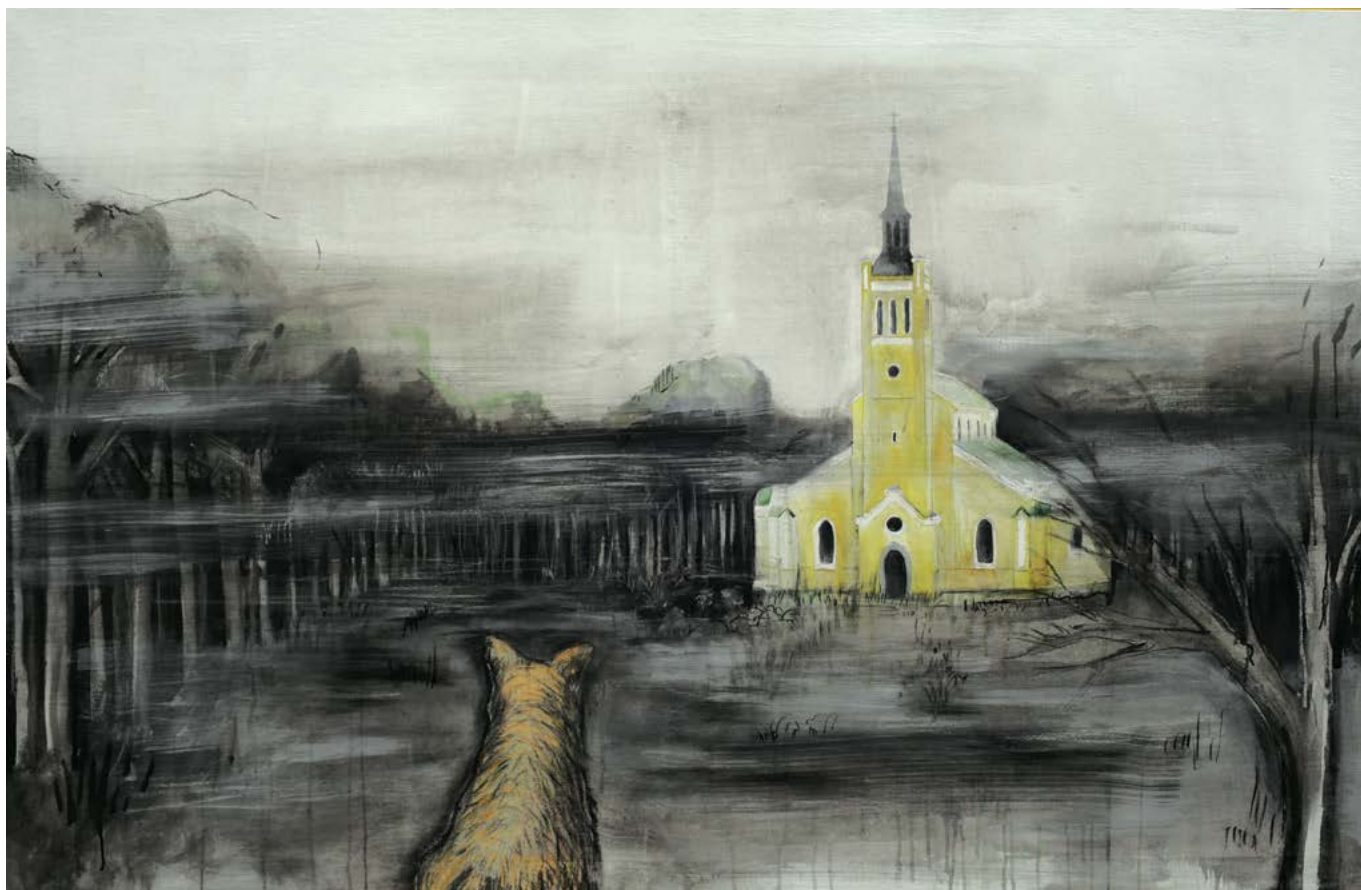
Düstoopiline Jaani kirik, Tallinn, Hübridjoonistus lõuendil + lameanimatsioon (flat-animation) 130 × 200 cm 2017